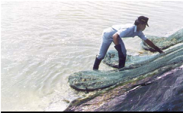
光滑、稳定的池塘堤岸加快了捕捞过程，为丰收提供了保障