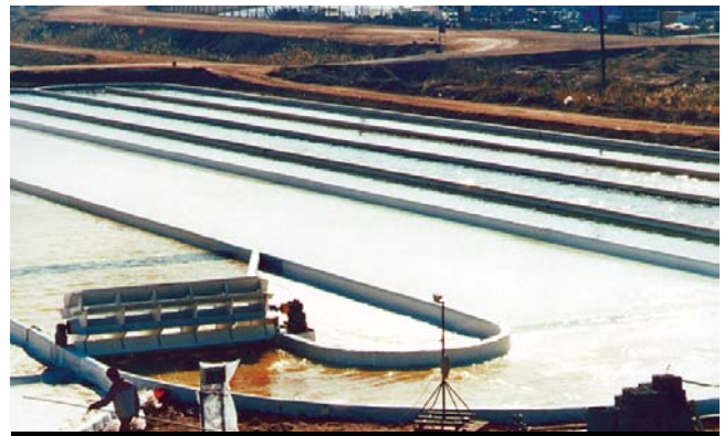
土工膜可以安装成任何形状并能与混凝土连接